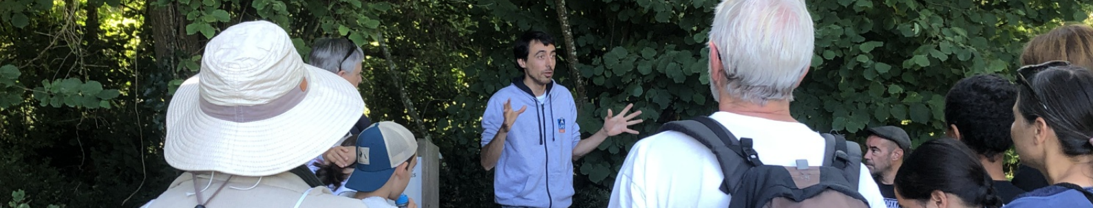
Sortie nature avec LPO à La Roche-sur-Yon