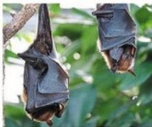
Une des animations sur la biodiversité organisée par la Ville de La Roche-sur-Yon sera consacrée aux chauves-souris (photo d'illustration).

Ces animations s'inscrivent dans la « démarche de l'Atlas de la biodiversité communale et la connaissance des continuités écologiques ». Chaque mois jusqu'en octobre 2023, la Ville de La Roche-sur-Yon propose aux habitants d'en apprendre plus