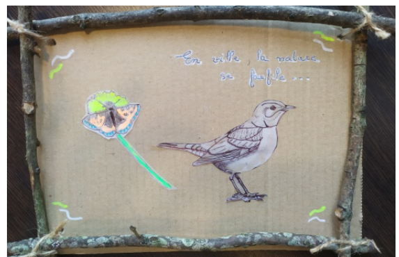
Réalisation lors de l'animation "Nature au coin de la rue"

Habituellement, l'équipe de la LPO Vendée réalise des interventions en milieu scolaire. Cette année, une réflexion a été menée afin de proposer des animations en lien avec le projet de renaturation des cours d'école.