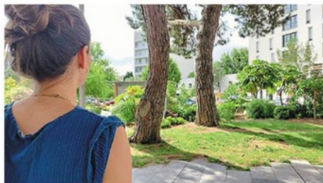
Découvrir la biodiversité de La Roche-sur-Yon, c'est la mission du programme Ma ville nature.

La Rosalie des Alpes et le grand Capricorne. Ces noms ne vous disent peut-être rien, mais ce sont des insectes qui vivent à La Roche-sur-Yon. Dans le cadre du programme Ma ville nature, la Ville et la LPO Vendée proposent aux curieux de les découvrir le mercredi 19 juillet. Le rendez-vous est à la maison de quartier du Val-d'Ornay à 15 h. Réservation au 07 62 55 59 74.